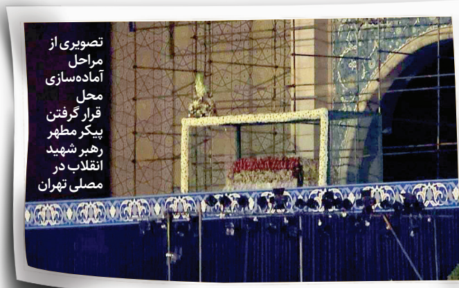
تصویری از مراحل آماده‌سازی محل قرار گرفتن پیکر مطهر رهبر شهید انقلاب در مصلی تهران