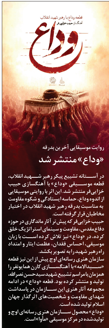
روایت موسیقایی آخرین بدرقه