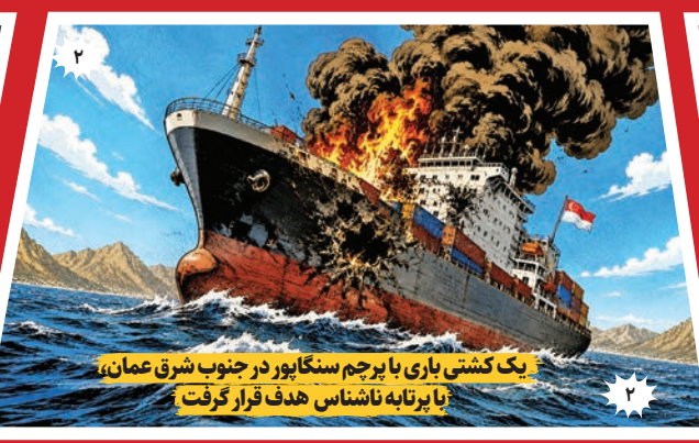
یک کشتی یاری با پرچم سنگاپور در جنوب شرق عمان، با برتایه ناشناس هدف قرار گرفت