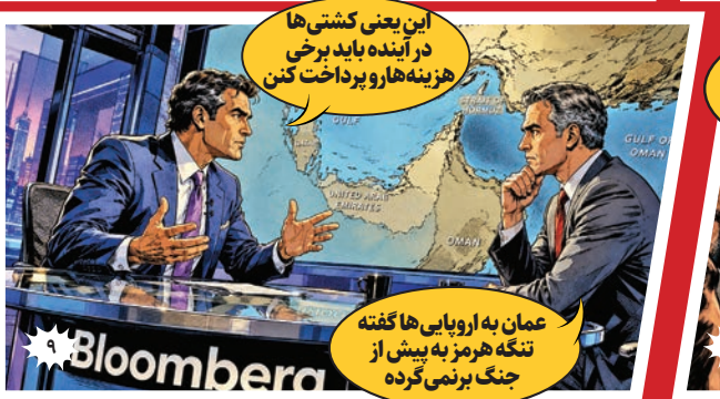
این یعنی کشتی‌ها در آینده باید برخی هزینه‌ها را پرداخت کنند