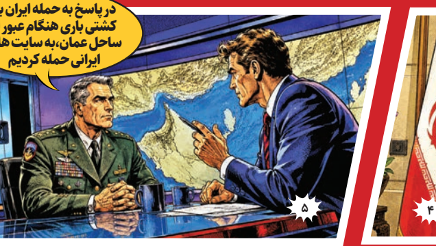
در پاسخ به حمله ایران به کشتی یاری هنگام عبور از ساحل عمان، به سایت‌های ایرانی حمله کردیم