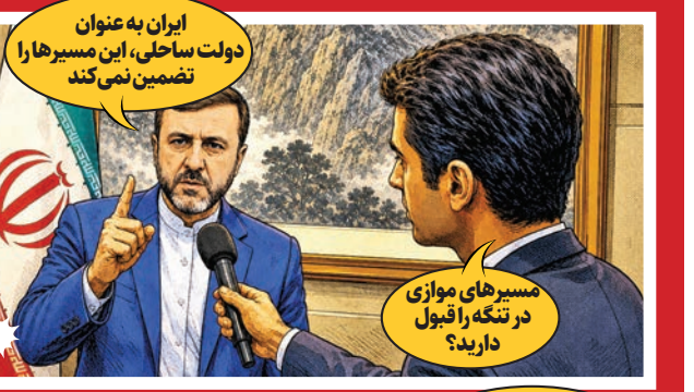
ایران به عنوان دولت ساحلی، این مسیرها را تضمین نمی‌کند