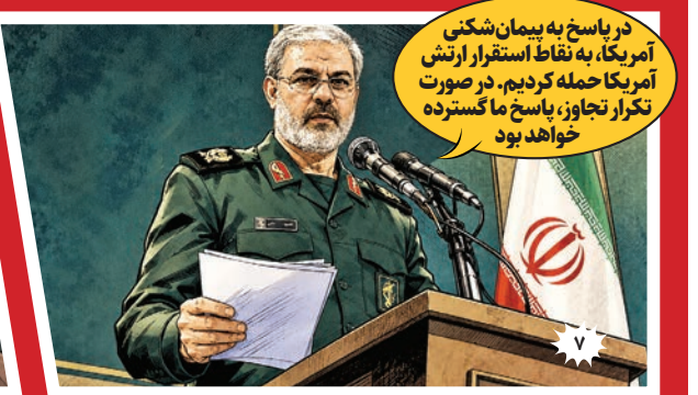
در پاسخ به پیمان شکنی آمریکا، به نقاط استقرار ارتش آمریکا حمله کردیم. در صورت تکرار تجاوز، پاسخ ما گسترده خواهد بود