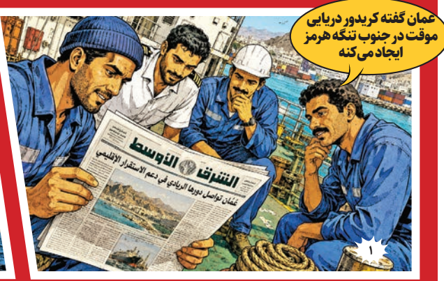
عمان گفته کرد بر دریای موقت در جنوب تنگه هرمز ایجاد می‌کنند