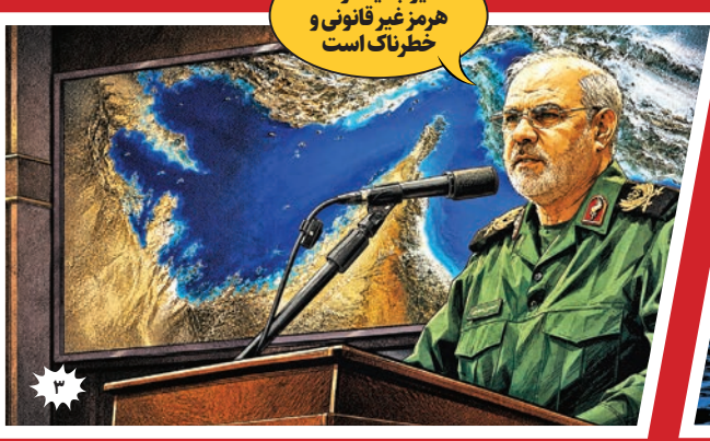
مسیر جدید در تنگه هرمز غیر قانونی و خطرناک است