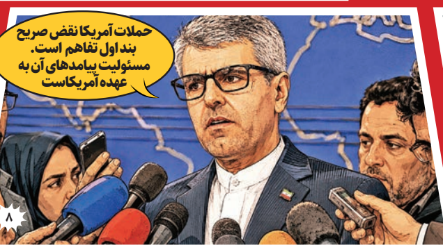
حمله آمریکا نقض صریح بند اول تفاهم است. مسئولیت پیامدهای آن به عهده آمریکاست