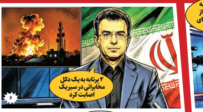
۲ برتایه با یک دکل مخابراتی در سیریک اصابند