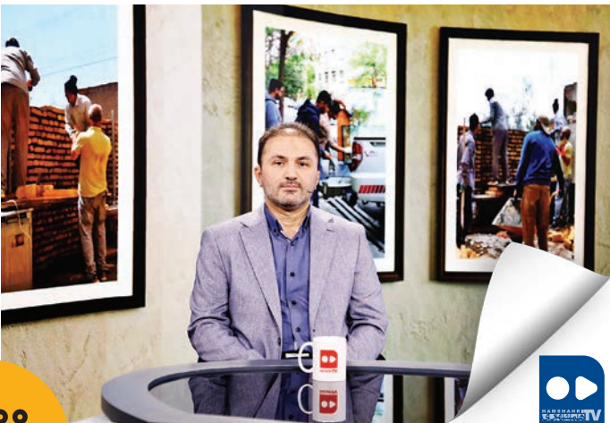
عین تصویر از روزنامه‌نگار

تعیین تکلیف همه واحدهای آسیب‌دیده در جریان جنگ تحمیلی ۲۴۰۰ واحد مسکونی، تجاری و اداری در منطقه ۱۴