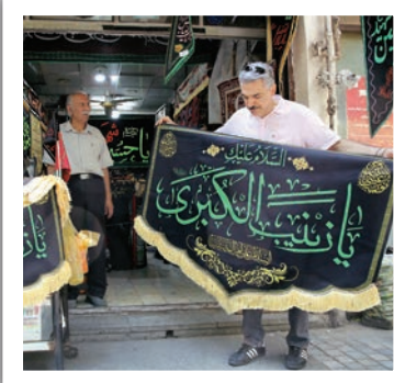
نبض تپنده بازار تهران؛ شور و تکاپوی شهروندان برای تهیه ملزومات هیئت‌ها و تکاپا در آستانه ماه عزای حسینی