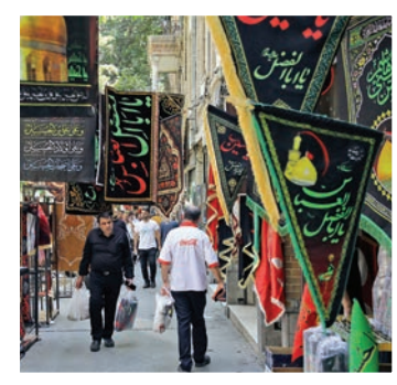
جلوه‌گری کتیبه‌ها و پرچم‌های سیاه در راسته بازار؛ هر آنچه برای سیاه‌پوش کردن کوچه‌پس‌کوچه‌های شهر لازم است، اینجا پیدا می‌شود.