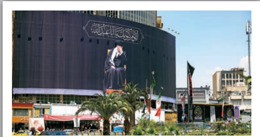
دیوارنگاره میدان ولیعصر، به مناسبت فرارسیدن عزاداری سید و سالار شهیدان و غم فراق «رهبر شهید» رونمایی شد.