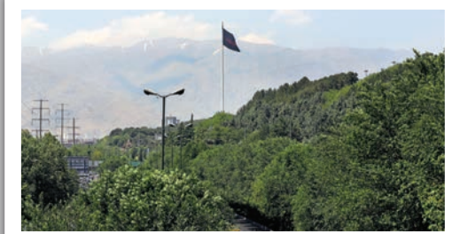
سایه سوگ بر گنبد مینا؛ بزرگ‌ترین پرچم عزای حسینی پایتخت در آیین «سلام بر محرم» بر فراز تپه‌های عباس آباد برافراشته شد.