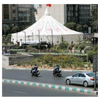
خیمه‌های برافراشته در قلب شهر؛ تکیه‌های عزای حسینی، یادآور واقعه کربلا، در میدان اصلی تهران برپا شده‌اند.