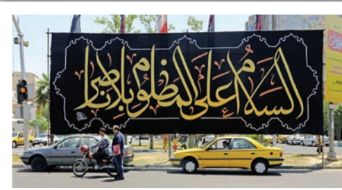
پایتخت، ردای سیاه بر تن می‌کند؛ نصب کتیبه‌های بزرگ مانند «السلام علی المظلومین» سیمای شهر را سوگوار کرده است.

که قرن‌هاست سینه‌به‌سینه به ما رسیده. انگار دیوارهای شهر هم به احترام، شانه‌هایشان را برای تکیه دادن به کتیبه‌ها پایین آورده‌اند. اینجا یک هم‌دلی نانووشته در جریان است؛ یک آمادگی قلبی که آرام آرام در چهره شهر هم نمایان می‌شود. تهران مهیبی میزبانی از بزرگ‌ترین و عزیزترین اندوهش می‌شود و این آمادگی از هر هیاهویی، عمیق‌تر و شنیدنی‌تر است.