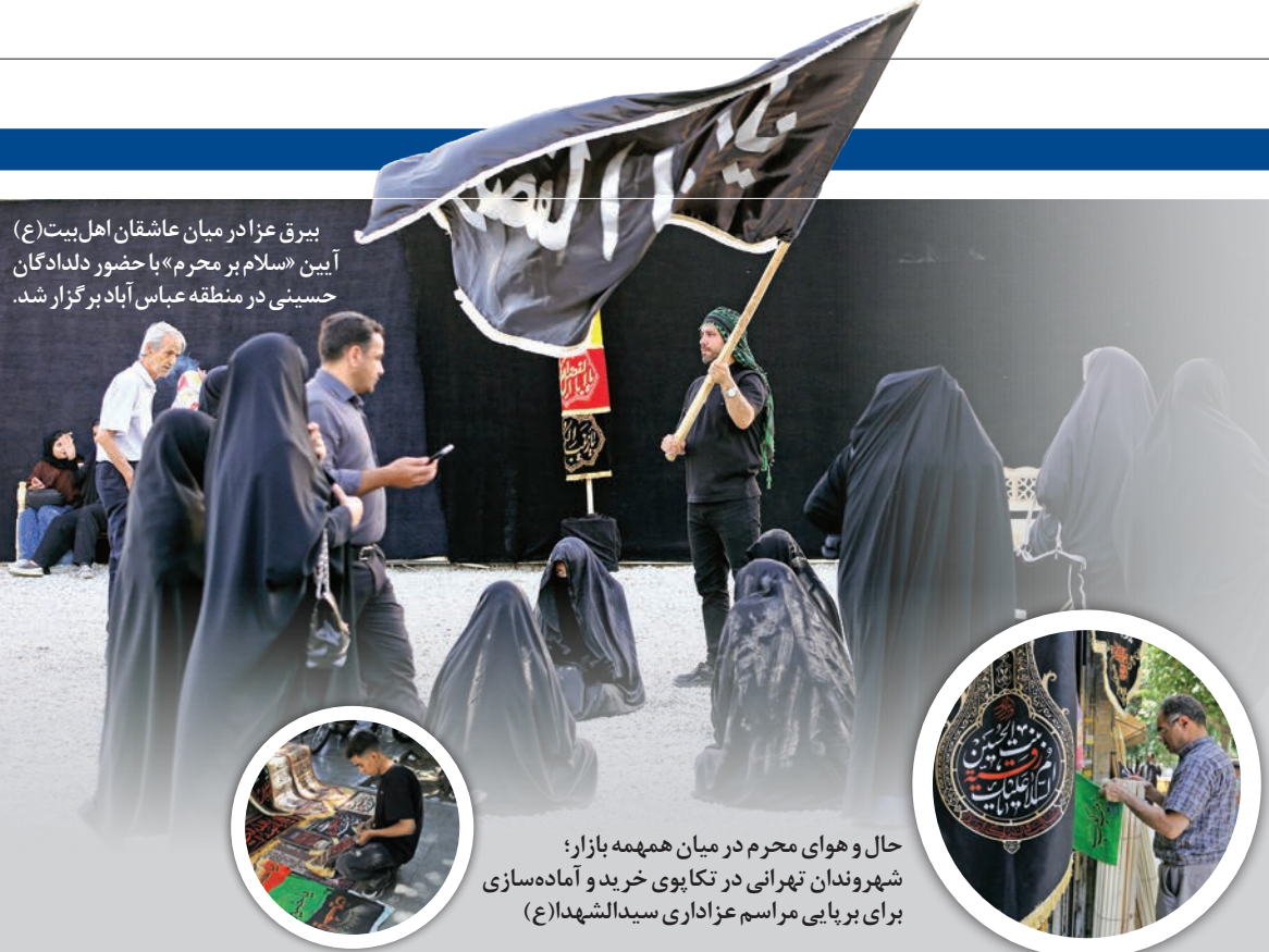
بیرق عزادار میان عاشقان اهل بیت (ع) آیین «سلام بر محرم» با حضور دلدادگان حسینی در منطقه عباس آباد برگزار شد.