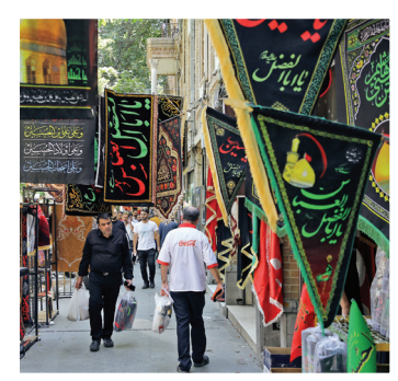
جلوه‌گری کتیبه‌ها و پرچم‌های سیاه در راسته بازار؛ هر آنچه برای سیاه‌پوش کردن کوچه‌پس‌کوچه‌های شهر لازم است، اینجا پیدا می‌شود.