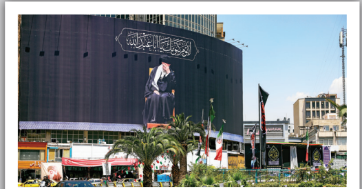
دیوارنگاره میدان ولیعصر، به مناسبت فرارسیدن عزاداری سید و سالار شهیدان و غم فراق «رهبر شهید» رونمایی شد.