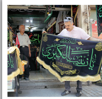
نبض تپنده بازار تهران؛ شور و تکاپوی شهروندان برای تهیه ملزومات هیئت‌ها و تکاپا در آستانه ماه عزای حسینی