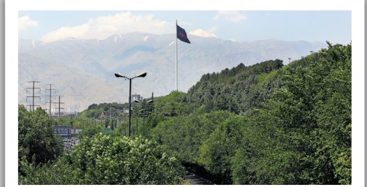
سایه سوگ بر گنبد مینا؛ بزرگ‌ترین پرچم عزای حسینی پایتخت در آیین «سلام بر محرم» بر فراز تپه‌های عباس آباد برافراشته شد.