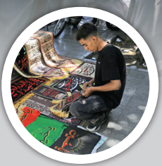
حال و هوای محرم در میان همه‌ها بازار؛ شهروندان تهرانی در تکاپوی خرید و آماده‌سازی برای یاری مراسم عزاداری سیدالشهدا (ع)