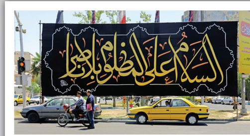
پایتخت، ردای سیاه بر تن می‌کند؛ نصب کتیبه‌های بزرگ مانند «السلام علی المظلوم بلاناصر» سیمای شهر را سوگوار کرده است.

که قرن‌هاست سینه‌به‌سینه به ما رسیده. انگار دیوارهای شهر هم به احترام، شانه‌هایشان را برای تکیه دادن به کتیبه‌ها پایین آورده‌اند. اینجا یک همدلی نانووشته در جریان است؛ یک آمادگی قلبی که آرام آرام در چهره شهر هم نمایان می‌شود. تهران مهیبی میزبانی از بزرگ‌ترین و عزیزترین اندوهش می‌شود و این آمادگی از هر هیاهویی، عمیق‌تر و شنیدنی‌تر است.