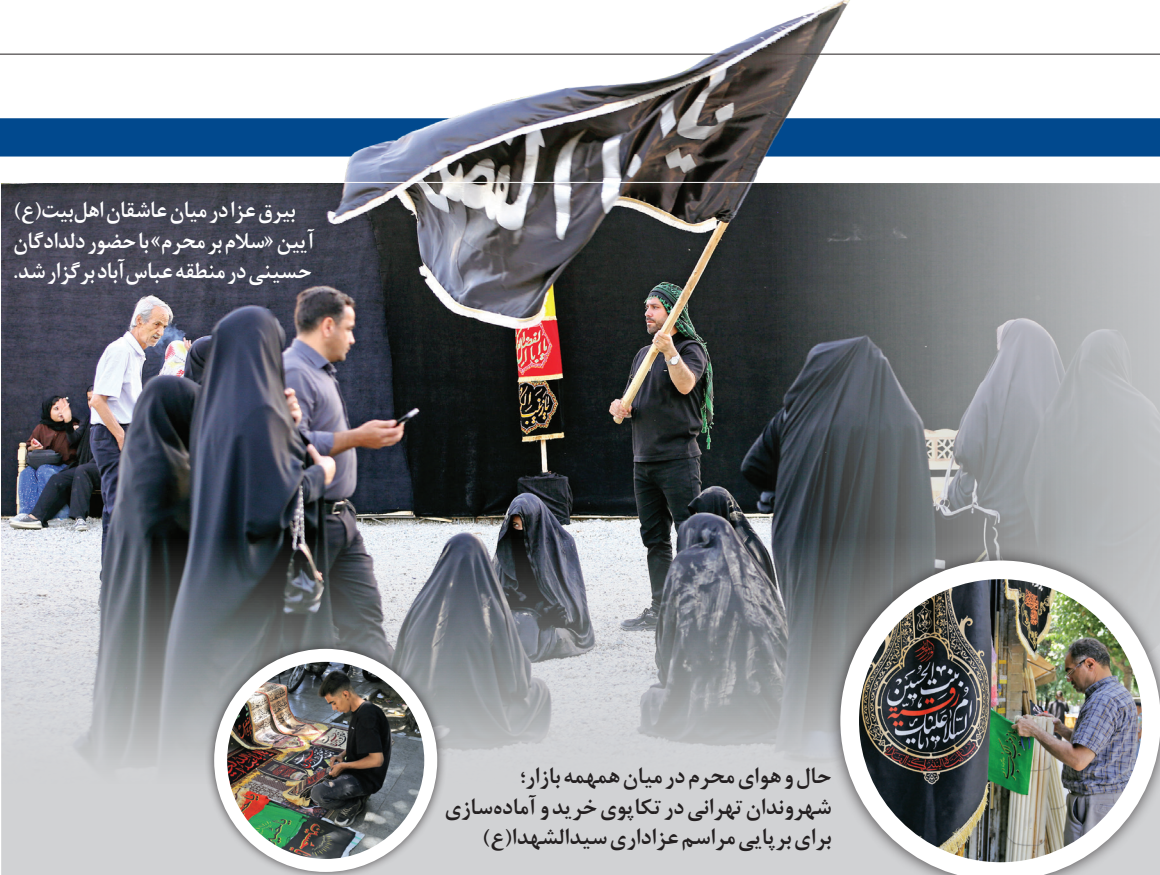
بیرق عزادار در میان عاشقان اهل بیت (ع) آیین «سلام بر محرم» با حضور دلدادگان حسینی در منطقه عباس آباد برگزار شد.