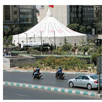
خیمه‌های برافراشته در قلب شهر؛ تکیه‌های عزای حسینی، یادآور واقعه کربلا، در میدان اصلی تهران برپا شده‌اند.