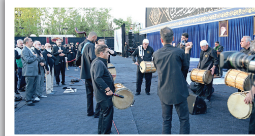
طنین طبل عزاداری طلیعه محرم؛ نوای سنج و دمام در آیین «سلام بر محرم»، فرارسیدن ماه سوگواری را اعلام می‌کند.