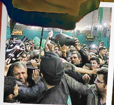
پهنه جنوب: اصالت عزاداری در دیار عاشقان جنوب شهر با هیئت‌های ریشه‌دار و عزاداری‌های سنتی، تصویری از اخلاص و ارادت بی‌ریای مردم این منطقه را به نمایش می‌گذارد.