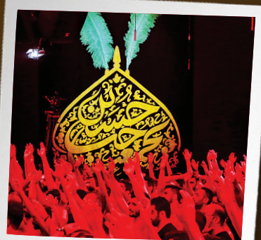
پهنه شمال: شمیران، خیمه‌گاه عاشقان در شمال پایتخت نیز هیئت‌های بزرگ و شناخته‌شده‌ای با حضور مداحان برجسته، میزبان عزاداران هستند.