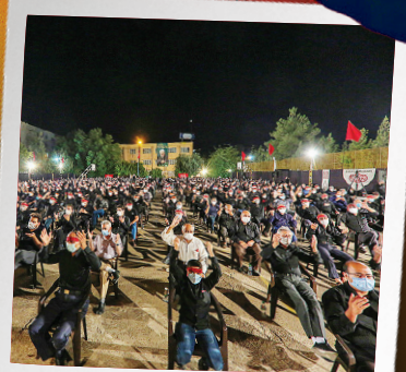
پهنه غرب: عزای حسینی در پایتخت مدرن در غرب تهران نیز مساجد و حسینیه‌های بزرگ، میزبان جوانان و خانواده‌هایی هستند که برای عرض ارادت گرد هم می‌آیند.