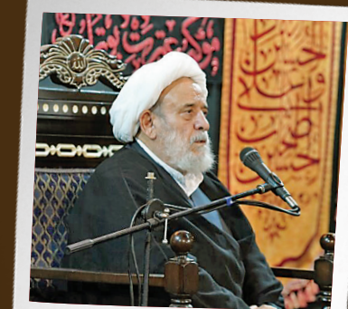
پهنه مرکز: قلب تپنده عزای تهران مرکز تهران با بافت تاریخی و مذهبی خود، همواره میزبان برخی از قدیمی‌ترین و پرشورترین مجالس عزاداری بوده است.

و هر هیئت، قلبی است که این جریان را زنده نگه می‌دارد. کافی است پس از غروب، دل به خیابان‌های شهر بزنید. تهران در این شب‌ها، قصه‌ای دیگر برای روایت کردن دارد؛ قصه‌ای که واژه‌هایش «یا حسین» است و قهرمانانش، مردمانی که از هر گوشه شهر، خود را به مجلسی می‌رسانند برای آرام گرفتن و همنوا شدن با کاروان عشق.