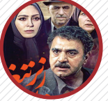
در دهه ۸۰ با سریال «زیر تیغ» آندوه را برای مخاطبان تلویزیون دراماتیزه کرد