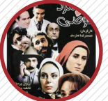
در دهه ۷۰ کمدهای رکوردشکن «مرد عوضی» را کارگردانی کرد