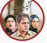
سریال کمدهای «آشپزباشی» آخرین کار هنرمند در تلویزیون بود و پس از سال‌ها سکوت «سمفونی نهم» را در سال ۱۳۹۷ کارگردانی کرد که موفقیتی در اکران عمومی به دست نیآورد

رهبرانی که هیولا هستند می‌کشند مردم را از یکدیگر جدا کنند رابرت دنیرو در جشنواره تریبکا: ما همیشه قدرت داستان‌سرایی را برای گرد هم آوردن مردم به کار برده‌ایم. این یک اصل راهنماست که به‌ویژه مهم شده، زیرا رهبرانی که هیولا هستند سعی می‌کنند ما را برای اهداف غیراخلاقی، ظالمانه و فاسد خود از هم جدا کنند. می‌دانید درباره چه کسی صحبت می‌کنم: دیگر، / وراثتی