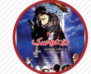
این کارگردان «درد عوسک‌ها» را که یکی از پرتماشاگرترین فیلم‌های سینمای پس از انقلاب بود در دهه ۶۰ برای مخاطبان کودک ساخت