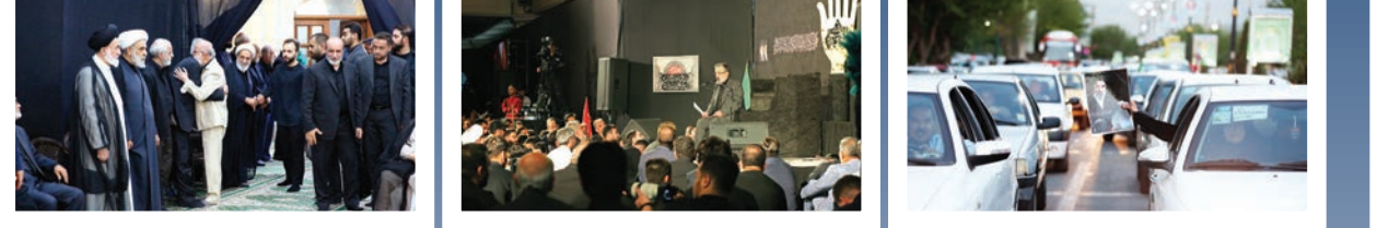
از میان شیشه خودروهایی که در تفریق مسیر یادبود ماندنند، دستی تصویر شهیدی را برافراشته است تا ارادت قلبی خود را به این مسیر ثابت کند.