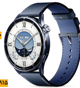
صفحه نمایش ۴۸/۱ اینچ رزولوشن ۴۸۰x۴۸۰ پیکسل وزن ۴۶ گرم باتری ۸۱۵ میلی آمپر ساعتی

شرکت شیائومی ساعت هوشمند جدید خود را با نام «واج اس ۵» معرفی و روانه بازار کرد. قیمت این ساعت که صفحه نمایش آن در مشخصات AMOLED آمده، حدود ۱۸۰ یورو اعلام شده است.