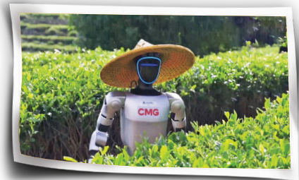
منبع: سنسنگام، مرکز مطالعات راهبردی و بین‌المللی، وال‌استریت ژورنال

چین در جریان بازی‌های جهانی روبات‌ها در سال ۲۰۲۶، روبات‌های انسان‌نما را در مزارع جای آزمایش می‌کند. این روبات‌ها وظایفی واقعی از چیدن برگ‌ها گرفته تا حمل بار را بر عهده دارند. روبات‌های انسان‌نما از آزمایشگاه‌ها به بیست‌های دوومیدانی و حالا هم به مزارع جای منتقل شده‌اند تا با چالش‌هایی روبه‌رو شوند که به ندرت در محیط‌های آزمایش روباتیک معمول دیده می‌شوند؛ دشواری‌هایی مثل دامنه‌های شیب‌دار و زمین‌های ناهموار، تعادل و تشخیص شکل برگ‌ها که سیستم‌های تشخیص بصری را به چالش می‌کشد.