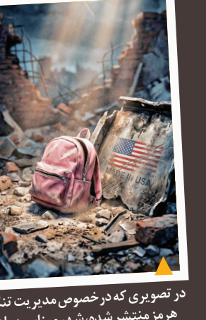
در تصویری که در خصوص مدیریت تنگه هرمز منتشر شده، شهر میناب به یاد دانش‌آموزان شهید مدرسه شجره طیبه با کوله پشتی مدرسه‌ای نشان داده شده است.