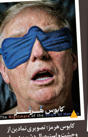
کابوس هر روز؛ تصویری نمادین از وحشت و استیصال دشمن در برابر تسلط بی‌چون‌وچرای ایران بر این شاهراه استراتژیک جهانی.