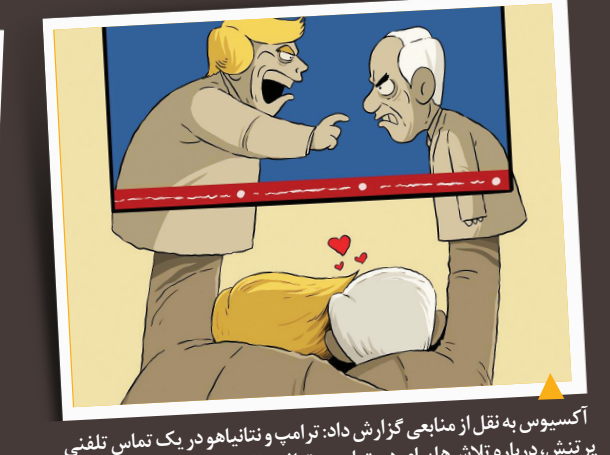
آکسیوس به نقل از منابعی گزارش داد: ترامپ و نتانیاهو در یک تماس تلفنی پر تنش، درباره تلاش‌ها برای دستیابی به توافق با ایران بحث و گفت‌وگو کردند و نتانیاهو پس از پایان این تماس، در حالت خشم بود. اما رابطه واقعی آنها را در این کارکتور می‌بینید.