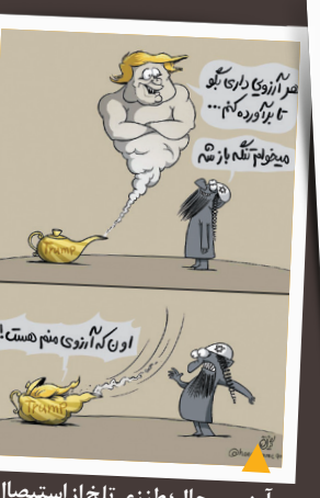
آرزوی محال؛ طنزی تلخ از استیصال مشترک آمریکا و اسرائیل در بازگشایی تنگه هرمز است.