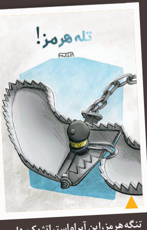
تنگه هرمز، این آبراه استراتژیک، دامی مهلک و یازدارنده برای هر متجاوز است که خیال خام عبور بی‌دردس از آن را دارد.