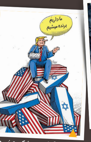
دروغی بزرگ که رهبر شکست‌خورده بر تلی از تلفات آمریکا و اسرائیل، آن را فریاد می‌زند.