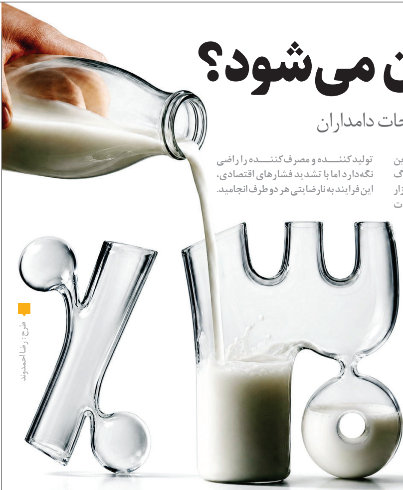
طرح: زهرا احمدپور

تولیدکننده و مصرف‌کننده را راضی نگه دارد اما با تشدید فشارهای اقتصادی، این فرایند به نارضایتی هر دو طرف انجامید. اعمال خواهد شد. به گزارش همشهری، این بار، تعیین قیمت لبنیات با یک تغییر بزرگ همراه بوده و مانند تجربه‌ای که قبلاً در بازار تخم‌مرغ اجرا شد، تعیین قیمت لبنیات به خود انجمن‌های لبنی واگذار شده است. واگذاری قیمت‌گذاری و تنظیم بازار تخم‌مرغ به تشکل‌های بخش خصوصی توانست هر دو طرف