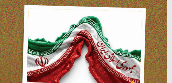
فراتر از یک شعار، این حقیقتی تغییرناپذیر است: امنیت و مالکیت این آبره حیاتی با رنگ‌های پرچم ایران گره خورده است.