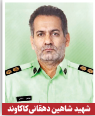
شهید شاهین دهقانی کارکنان

عامل شهادت سرهنگ دوم شاهین دهقانی کاکاوند از مأموران کلانتری ۱۲ شهر ملارد که در جریان حمله گروهی اغتشاشگران با ضربات اسلح سرد به قتل رسیده بود، سحرگاه دیروز در محوطه زندان شهرستان کرج قصاص شد. به گزارش همشهری، سرهنگ دهقانی و همکارانش شامگاه ۱۷ دی‌ماه سال گذشته در میدان ارغوان شهرستان ملارد حضور داشتند که با هجوم گروهی از اغتشاشگران روبه‌رو شدند. مأموران که سلاحی همراه نداشتند، ناچار به ترک محل شدند اما در این میان سرهنگ دهقانی که از همکاریش جدا افتاده بود، هدف حمله چند نفر از مهاجمان قرار گرفت. یکی از مهاجمان که سربیزه در دست داشت به همراه فرد دیگری مأمور پلیس را در کوجهای تعقیب و با وارد کردن ضربات متعدد سلاح سرد، او را به شدت مجروح کرد. در ادامه نیز افراد دیگری با پرتاب سنگ و ضربات چاقو به این حمله پیوستند. این مأمور پلیس بر اثر شدت جراحات به شهادت رسید.