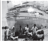
سفر دریایی به استرالیا