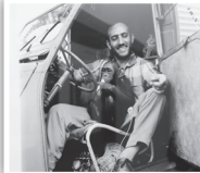
سفر به آفریقا