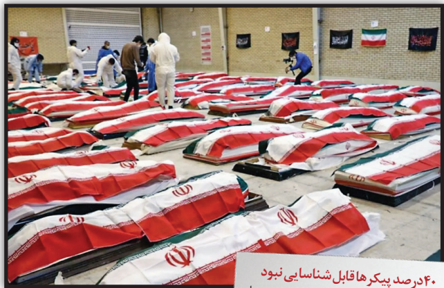
۴۰ درصد پیگرها قابل شناسایی نبود

در جنگ تحمیلی سوم به‌دلیل نوع بمب‌ها و موشک‌های به‌کار گرفته شده از سوی دشمن شاهد جنایت گسترده‌ای بودیم؛ طوری که حدود ۴۰ درصد پیگرهای شهدا در ابتدا قابل شناسایی نبودند، اما همکاران ما در سراسر کشور به‌ویژه در تهران، اصفهان و هرمزگان با تلاش خود موفق شدند این پیگرها را شناسایی کنند.