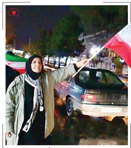
ای ایران ای مرز پرگهر حضور انسیه شاه حسینی، کارگردان زن سینما در تجمع مردم در میدان انقلاب