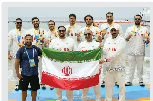
▲ قهرمانی واترپلو با پیروزی مقابل چین