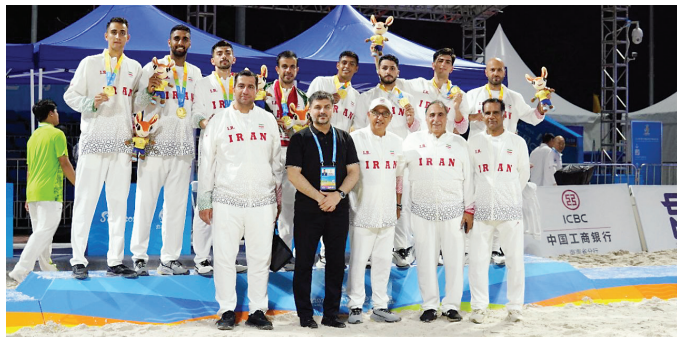
▲ قهرمانی هندبال با پیروزی بر قطر