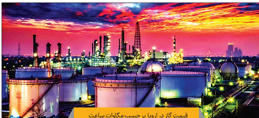
قیمت گاز در اروپا بر حسب مگاوات ساعت

اختلال در مسیر رسیدن گاز از خلیج فارس به قاره سبز، قیمت‌ها را به شدت بالا برده است