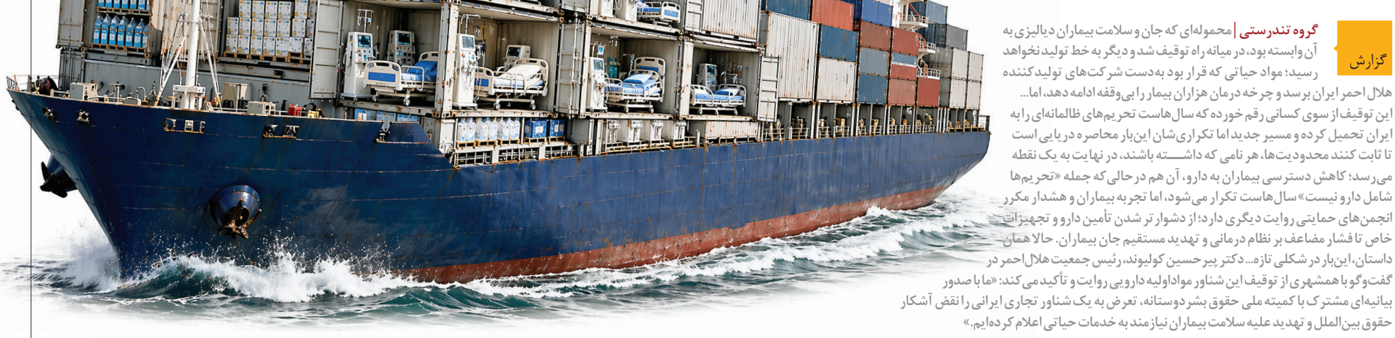
گروه تندرستی | محموله‌های کتان و سلامت بیماران دیالیزی به آن وابسته بود، در میانه راه توقیف شد و دیگر به خط تولید نخواهد رسید؛ مواد حیاتی که قرار بود به دست شرکت‌های تولیدکننده هلال احمر ایران برسد و چرخه در زمان هزاران بیمار را بی‌وقفه ادامه دهد، اما... این توقیف از سوی کسانی رقم خورده که سال‌هاست تحریم‌های ظالمانه‌ای را به ایران تحمیل کرده و مسیر جدید اما تکراری شان این بار محاصره دریایی است تا ثابت کنند محدودیت‌ها، هر نامی که داشته باشند، در نهایت به یک نقطه می‌رسد؛ کاهش دسترسی بیماران به دارو، آن هم در حالی که جمله «تحریم‌ها شامل دارو نیست» سال‌هاست تکرار می‌شود، اما تجربه بیماران و هشدار مکرر انجمن‌های حمایتی روایت دیگری دارد؛ از دشوار تر شدن تأمین دارو و تجهیزات خاص تا فشار مضاعف بر نظام درمانی و تهدید مستقیم جان بیماران. حالا همان داستان، این بار در شکلی تازه... دکتر پیر حسین گولیوند، رئیس جمعیت هلال احمر در گفت‌وگو با همشهری از توقیف این شناور مواد اولیه دارویی روایت و تأکید می‌کند: «ما با صدور بیانیه‌های مشترک با کمیته ملی حقوق بشر دوستانه، تعرض به یک شناور تجاری ایرانی را نقض آشکار حقوق بین‌الملل و تهدید به‌علیه سلامت بیماران نیازمند به خدمات حیاتی اعلام کرده‌ایم.»

رئیس جمعیت هلال احمر ایران از جزئیات و پیگیری‌های بین‌المللی توقیف محموله حیاتی بیماران دیالیزی توسط نیروهای آمریکایی