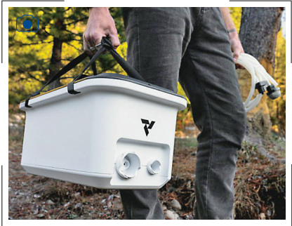
همه‌جا آب تصفیه می‌شود

یک استارت‌آپ مستقر در کالیفرنیا به نام «ویتال لایف» (Vital Life) اعلام کرد که نخستین محصول خود را که یک سیستم تصفیه آب قابل‌حمل است، تولید کرده است. این دستگاه که با باتری کار می‌کند، می‌تواند آب آشامیدنی سالم را از هر منبعی از جمله آب دریا در صورت نیاز فراهم کند. کافی است که یک لوله را در هر جایی که آب وجود دارد، قرار دهید و «اکسس» (Access) به‌طور آن را به آب آشامیدنی پاک و ایمن تبدیل می‌کند.