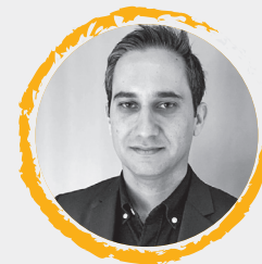
مدیر وطن فروشان

با گذشت چند روز از صدور حکم توقیف اموال ۴۰۰ وطن فروش، بررسی ها نشان می دهد که این روند با قدرت ادامه دارد و قرار است ضمن شناسایی همه اموال این افراد، اموال سایر افرادی که در جبهه دشمن قرار دارند نیز از سوی قوه قضاییه شناسایی و توقیف شود. حجت الاسلام والمسلمین حمزه خلیلی، معاون اول قوه قضاییه درباره این رویکرد دستگاه قضایی در فضای مجازی نوشت: با استفاده و بهره گیری از ظرفیت های قانونی خصوصا قانون موضوع تشدید مجازات جاسوسی، توقیف و مصادره اموال عناصر مزدور، وطن فروش و حامی متجاوز کماکان با قدرت و اقتدار استمرار و ادامه دارد. در این رابطه دستور لازم قانونی به منظور تسریع در رسیدگی صادر شده است.