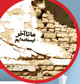
ماتا آخر ایستاده‌ایم