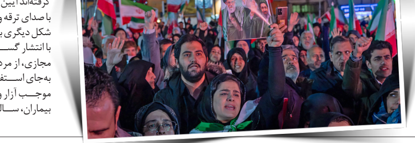
کودکان بی گناه به شهادت رسیده‌اند.

این اتفاقی یادآور یک حرف مفت در تاریخ معاصر کشورمان نیز هست. در سال‌های پیش از پیروزی انقلاب اسلامی، مقامات رژیم پهلوی نیز با ادعاهای مشابهی سعی کردند حضور انبوه مردم را در خیابان‌ها به چالش بکشند. آن