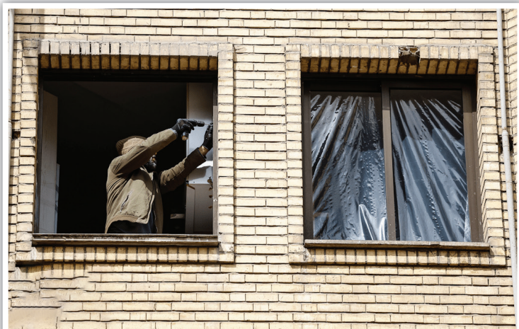
صدای دریل‌ها جایگزین سکوت دلهره‌آور شده است؛ تلاش بی‌وقفه نیروهای فنی برای پیچ کردن و تثبیت نهایی چهارچوب‌های جدید پنجره‌ها.