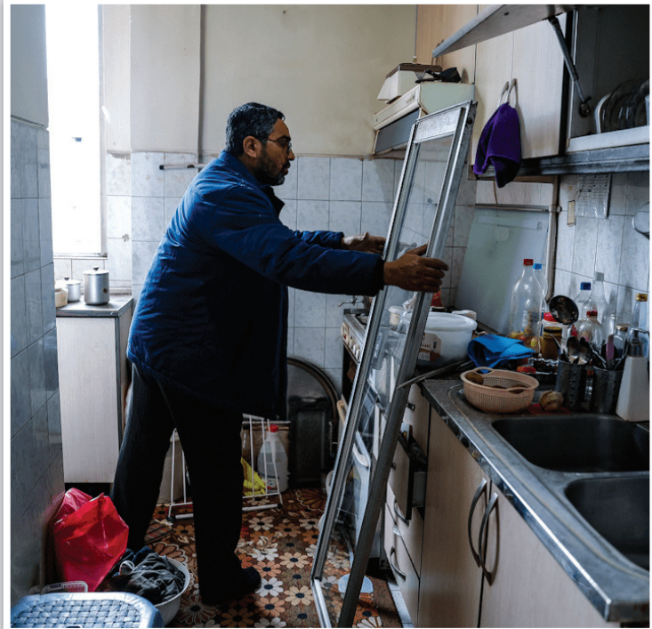
حضور نیروهای جهادی محدود به سن خاصی نیست؛ انتقال قاب‌های جدید به داخل آشپزخانه خانه‌ای که حریمش آسیب دیده است.