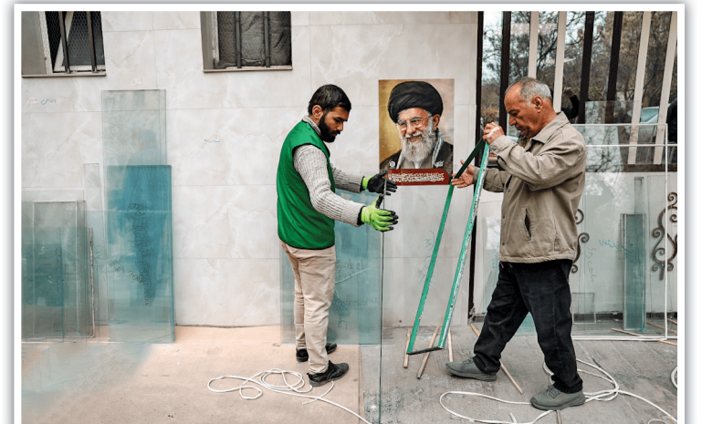
تلاقی تجربه و جوانی در میدان خدمت؛ آماده‌سازی و اندازه‌گیری دقیق شیشه‌ها با مشارکت نیروهای جهادی و اهالی دغدغه‌مند محله.