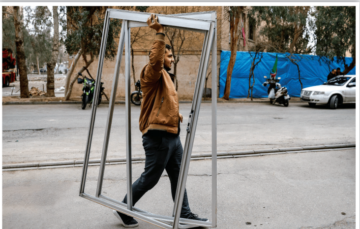
اراده‌هایی محکم‌تر از آهن؛ انتقال انفرادی و سریع قاب‌های بزرگ آلومینیومی به سمت بلوک‌های آسیب دیده برای تسریع در روند بازسازی.