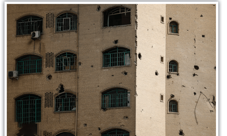
رد تلخ ویرانی بر بیکر ساختمان؛ پنجره‌های درهم شکسته و دیوارهای ترکش خورده که بی‌صبرانه در انتظار لمس دست‌های سازنده جهادگران هستند.