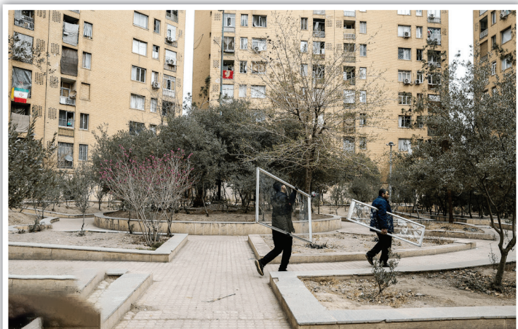
انتقال پنجره‌های جایگزین از محوطه مجتمع‌های مسکونی؛ تلاش بی‌وقفه برای اینکه هیچ خانواده‌ای امشب را در خانه‌ای بدون پنجره سر نکند.