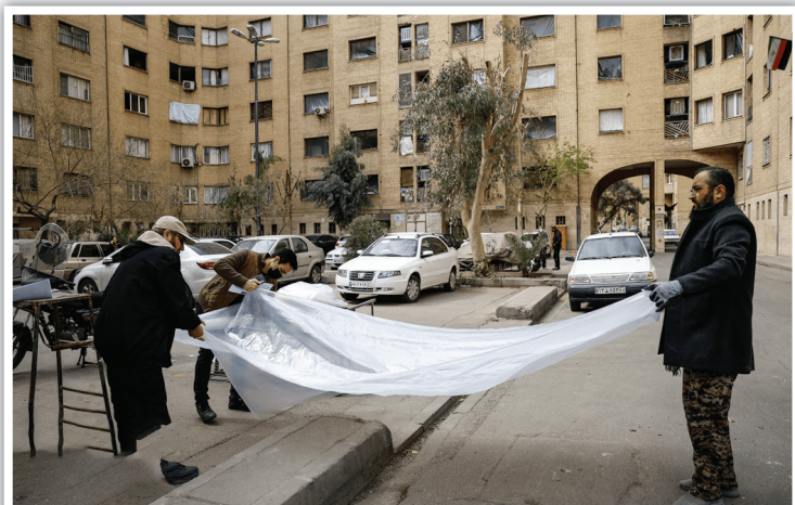
تا پیش از نصب شیشه‌ها، هیچ خانه‌ای بی حفاظ نمی ماند؛ برش گروهی پلاستیک‌های ضخیم برای پوشش موقت قاب‌های فروریخته آپارتمان‌ها.