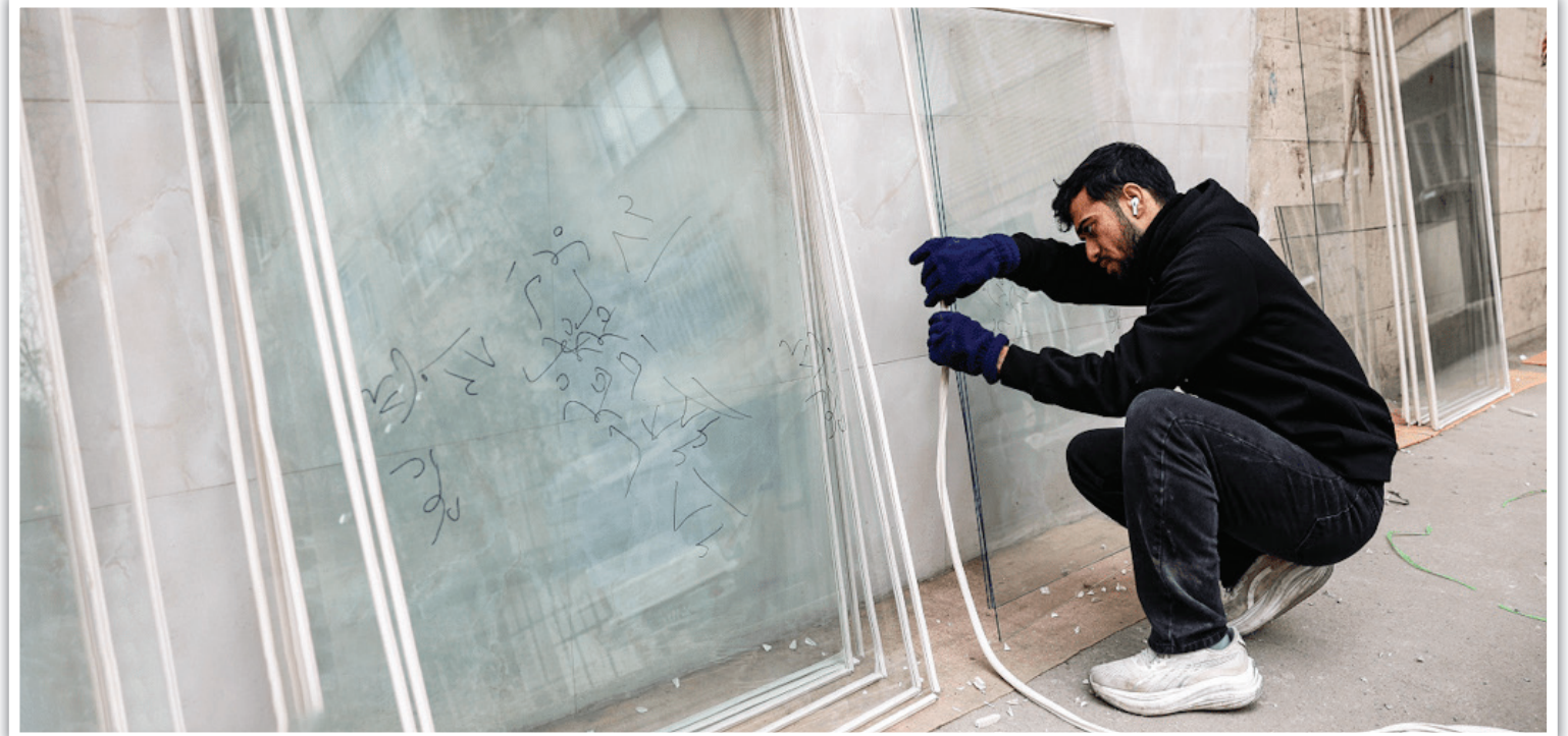
یکی از دانشجویان در حال آماده‌سازی و عایق‌بندی شیشه‌های جدید، پیش از انتقال به طبقات ساختمان‌های آسیب دیده است.