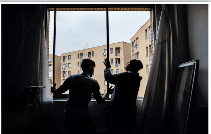
جاگذاری دقیق چهارچوب‌های فلزی در طبقات بالایی؛ تلاش گروهی دانشجویان برای بازگرداندن سریع امنیت به آپارتمان‌های خسارت دیده از انفجار.