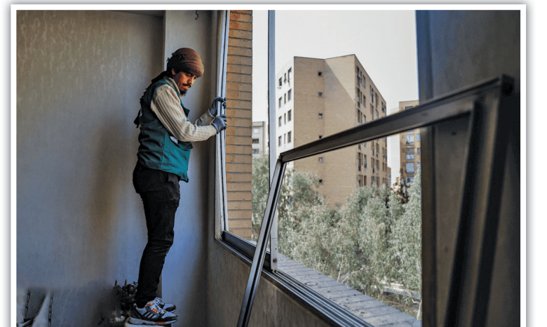
نصب فریم‌های جدید با کمترین امکانات و بیشترین دقت؛ یک نیروی جهادی در حال تراز کردن پنجره واحد مسکونی.