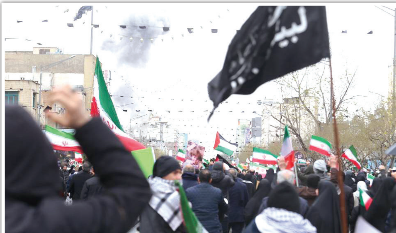
حماسه حضور در میان دود و آتش؛ مردم آگاه با وجود حملات وحشیانه دشمن در نزدیکی مسیر راهپیمایی، بر میثاق استوار خود با آرمان قدس و رهبری جدید انقلاب پافشاری کردند.

روز قدس امسال، به نوعی تداوم روزها و شب‌های حضور مردم در خیابان هم بود که برای ناکام گذاشتن دشمنان در ایجاد آشوب‌های داخلی آغاز شد و هنوز تداوم دارد؛ حتی در سرمای شدید این روزها و زیر بارش بمب‌ها و موشک‌ها. با هم تصاویری از این حضور خاص را مرور می‌کنیم.