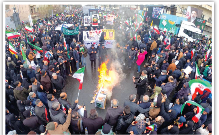
طنین فریاد استکبارستیزی در قلب پایتخت؛ مردم تهران با آتش زدن نمادهای دشمن، بار دیگر بر ایستادگی و تجدید بیعت با رهبری جدید انقلاب در میانه نبرد تأکید کردند.