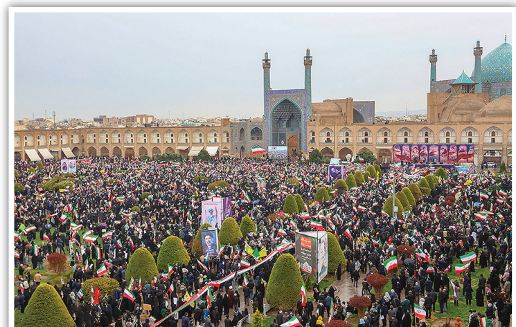
میدان نقش جهان اصفهان میزبان خیل عظیم دلدادگانی بود که با حضور میلیونی خود در روز قدس، بر میثاق ابدی با آرمان فلسطین و بیعت با رهبری جدید در اوج اقتدار تأکید کردند.