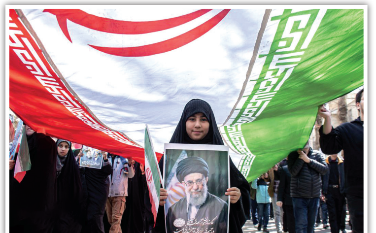
جلوه‌ای از بصیرت نوجوانان در راهپیمایی روز قدس بجنورد؛ اهتزاز پرچم ایران و تصویر رهبری، پیامی روشن از پایداری نسل‌های جدید در مسیر مقاومت و وفاداری به آرمان‌های انقلاب اسلامی است.