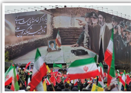
دیوارنگاره میدان انقلاب در روز قدس، تجلی‌گاه میثاق امت با رهبری جدید است. جمعیتی که با پرچم‌های برافراشته، تداوم ایستادگی و پیروزی نهایی بر دشمن را در میدان فریاد می‌زنند.