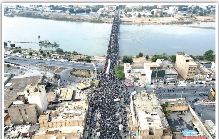
حماسه حضور مردم اهواز بر فراز پل‌های شهر؛ خروشی سهمگین علیه استکبار که نشان داد تهدیدهای دشمن در ایام نبرد، هرگز نمی‌تواند مانع از تجدید بیعت امت با ولایت شود.