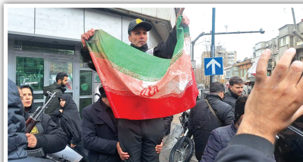
پیکر مطهر شهید راهپیمایی و پرچم رنگین به خون اوست؛ سندی از جنایت دشمن و پایداری ملتی که میان آتش، بر عهد خود با آرمان قدس و رهبری استوار است.