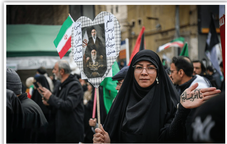
حضور میلیونی زائران و مجاوران در مشهد مقدس؛ پایتخت معنوی ایران در روز قدس، یکصدا فریاد ایستادگی سر دادند و بر تداوم مسیر مقاومت و بیعت با رهبر جدید انقلاب تأکید کردند.