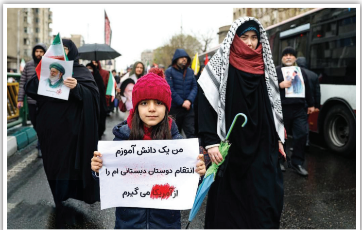
حضور آگاهانه دانش‌آموزان تهرانی به یاد هم‌کلاسی‌های شهیدشان در مدرسه میثاب؛ نسلی که در میانه نبرد، با شعار انتقام از دشمن، عهد خود را با آرمان‌های انقلاب و رهبری تجدید کرد.