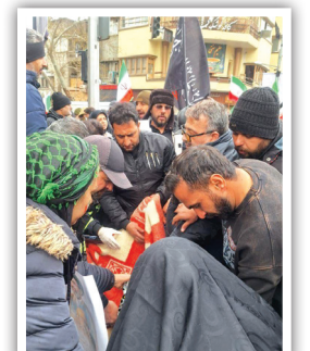
جلوه‌ای از بصیرت نوجوانان در راهپیمایی روز قدس بجنورد؛ اهتزاز پرچم ایران و تصویر رهبری، پیامی روشن از پایداری نسل‌های جدید در مسیر مقاومت و وفاداری به آرمان‌های انقلاب اسلامی است.