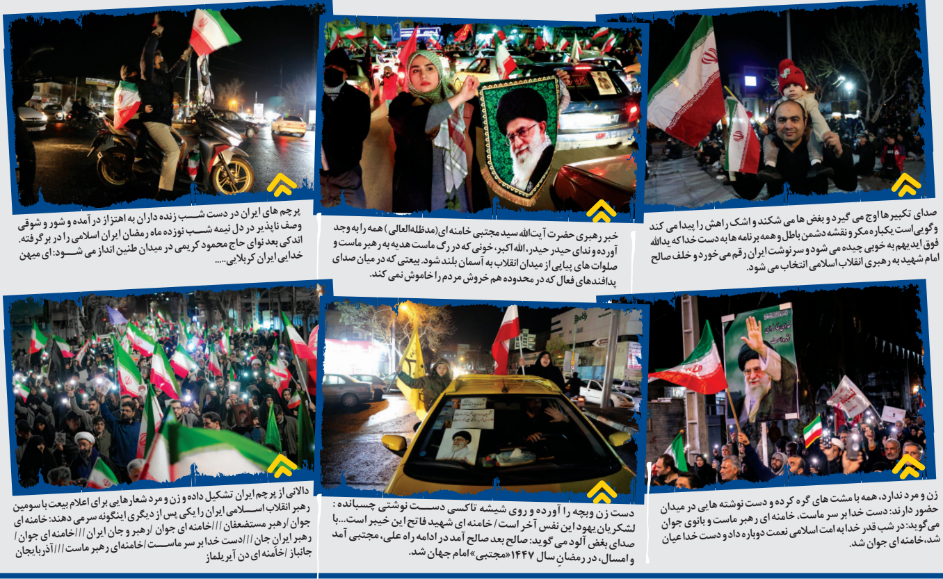
صدای تکبیر هاوچ می‌گیرد و بغض‌ها می‌شکند و اشک راهش را پیدا می‌کند و گویی است یکباره مگر و نقشه دشمن باطل و همه برنامه‌ها به دست خدا که بدالله فوق‌الذمیر به خوبی دیده می‌شود و سرنوشت ایران رقم می‌خورد و خلف صالح امام شهید به رهبری انقلاب اسلامی انتخاب می‌شود.

می‌شود و پرچم‌های در دستان مردم برافراشته. مردمی که پیش از آن در گوشه گوشه میدان کز کرده بودند. اینک قامت راست کنان و با مشت‌های گره کرده، شعارهای الله اکبر و لبیک با خامنه‌ای سراسر می‌دهند.