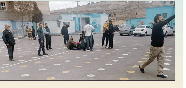
آواربرداری مدرسه میناب ادامه دارد

گروه سرزمین من | روز شنبه (۹ اسفند) ۲۰ استان کشور مورد تجاوز نظامی و حمله آشکار نیروهای آمریکا و رژیم صهیونیستی قرار گرفتند و ۲۰۱ شهید و ۷۴۷ مجروح برجای گذاشت. هدف این حمله‌ها در ۲ استان مستقیماً کودکان و بیماران بودند؛ هرگز گان و قزوین. در میناب استان هرمزگان یک مدرسه دخترانه با بیش از ۱۵۰ دانش‌آموز مورد حمله قرار گرفت و در آبیگ استان قزوین یک مدرسه پسرانه با بر خورد ترکش راکت آسیب دید.