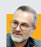
آمدادگی هوشیار، شهردار تبریز؛ خدمات‌رسانی مترو تبریز تا روز پنجشنبه رایگان خواهد بود. سالن‌های ورزشی شهر و ایستگاه‌های مترو برای مواقع بحرانی و اسکان اضطراری آماده بودند. مجموعه شهرداری همچون گذشته به‌صورت شبانه‌روزی در تمامی حوزه‌ها به شهروندان خدمات‌رسانی خواهند کرد.

فعالیت سامانه بارشی امروز یکشنبه (۱۰ اسفند) در نوار شمالی کشور و زاگرس مرکزی ادامه دارد. امروز برای ۱۶ استان هشدار هواشناسی سطح زرد صادر شده است. به گزارش همشهری، امروز شدت بارش در شمال آذربایجان غربی، نیمه شمالی آذربایجان شرقی، نیمه جنوبی اردبیل، گیلان، مازندران، گلستان، خراسان شمالی، خراسان رضوی، ارتفاعات سمنان، تهران، البرز و قزوین، نیمه شمالی فارس، کهگیلویه و بویراحمد، چهارمحال و بختیاری، شرق و شمال خوزستان با هشدار هواشناسی سطح زرد همراه است و علاوه بر بارش باران و برف در ارتفاعات این مناطق، وزش باد شدید موقتی و کاهش نسبی دما نیز رخ می‌دهد. از سفرهای غیرضروری به این مناطق پرهیز کنید. سرمای هوا با نفوذ توده‌های سرد همچنان ادامه دارد. بر اثر این پدیده، یخبندان‌های شبانه و صبحگاهی رخ می‌دهد. کاهش دما که روز گذشته در نوار شمالی کشور آغاز شده بود امروز به سایر نقاط کشور می‌رسد و همراه داشتن تجهیزات زمستانی در تردهای برون شهری ضروری است.