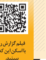
فیلم گزارش را با اسکن این کد ببینید