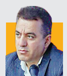
آمدادگی هوشیار، شهردار تبریز؛ خدمات‌رسانی مترو تبریز تا روز پنجشنبه رایگان خواهد بود. سالن‌های ورزشی شهر و ایستگاه‌های مترو برای مواقع بحرانی و اسکان اضطراری آماده بودند. مجموعه شهرداری همچون گذشته به‌صورت شبانه‌روزی در تمامی حوزه‌ها به شهروندان خدمات‌رسانی خواهند کرد.