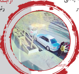
بعضی بودن یکی از گروگان‌ها

بررسی‌ها حکایت از این داشت که مزرعه متعلق به یک استاد دانشگاه است که ۳ کارگر افغان در آنجا به‌عنوان نگهداران مشغول به کار بودند. همچنین تعدادی سنگ در مزرعه وجود داشت که اعضای این باند آرش را برای ایجاد رعب و وحشت و جلوگیری از فرار گروگانگیران در محیط گماشته بودند. از مخفیگاه آنها قهقهه و کلت‌کمری نیز کشف و ضبط شد.