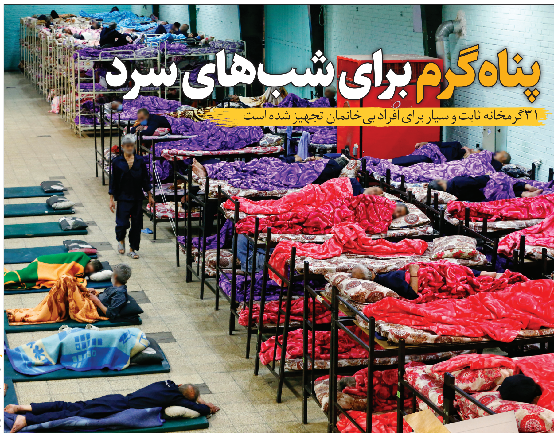
۳۱ گرمخانه ثابت و سیار برای افراد بی خانمان تجهیز شده است