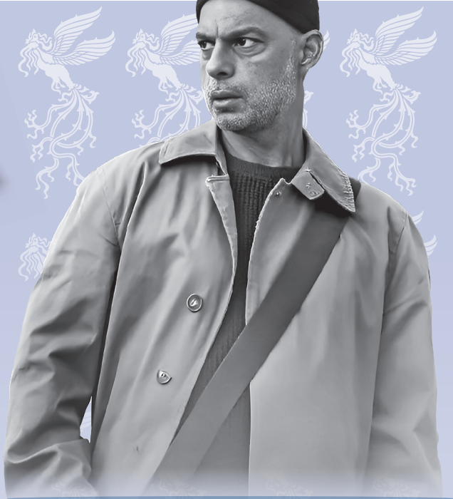
ساخته احمد بهرامی