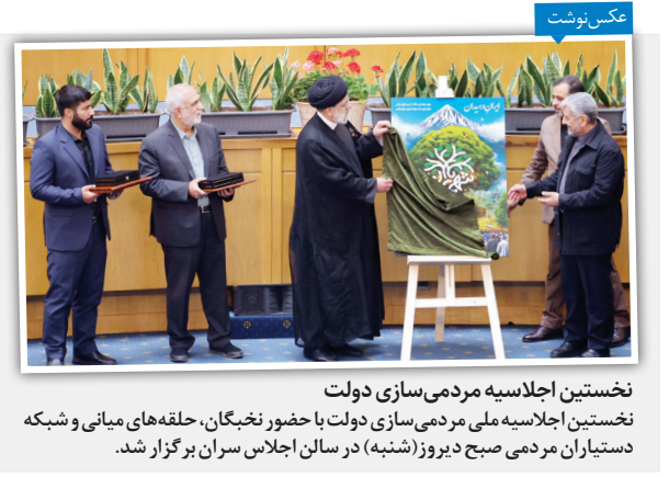
نخستین اجلاس هیئت مدیره ملی مردمی سازی دولت در تهران

چرخش ریاض به سمت قدرت‌های شرقی «امنیت منطقه محور»، از جمله اهداف سیاست خارجی منطقه‌ای ایران در خلیج فارس و غرب آسیا بوده است و ایران همواره بر اخراج نیروهای خارجی و آمریکایی از منطقه تأکید دارد. از طرفی، میانجیگری موفق چین در بازگشایی پنجره‌های همسایگی ایران و عربستان، نتیجه روابط همسو و نزدیک تهران و ریاض با دوست مشترکی به نام یکن محسوب می‌شود. در واقع چین توانسته با بازی پر رنگ خود در خلیج فارس، منافع مشترکی را با ایران و عربستان دنبال کند. این در حالی است که طی ۴ دهه گذشته ائتلاف ریاض - واشنگتن هیچ‌گاه نتوانست منافع مشترکی با تهران داشته باشد، اما اکنون هم ریاض و هم تهران با چین به‌عنوان یک شریک سیاسی و اقتصادی بزرگ هم‌ائتلاف هستند.