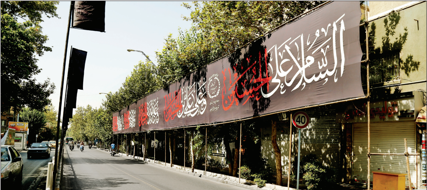
عکس همسفرهای راهزناناله