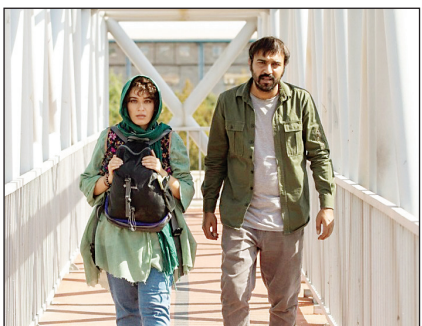
«آمستر دام» سریال که بازودی پخش خواهد شد

«زاپاتا» در نخستین حضور بین‌المللی‌اش در بخش «تولیدی دیگر» سینمای ایران اینجا و اکنون «جشنواره فیلم کار لووی واری» نمایش داده می‌شود. فیلم سینمایی «زاپاتا» تاکنون بیشترین ساخته‌شده‌اش برای نمایش در پنجاه هفتمین جشنواره فیلم کار لووی واری انتخاب شد. زاپاتا در نخستین حضور بین‌المللی‌اش در بخش «تولیدی دیگر» سینمای ایران اینجا و اکنون «جشنواره فیلم کار لووی واری» نمایش داده می‌شود. این بخش از جشنواره مختص فیلم‌های مستقل، شاعرانه و پیشروی سینمای ایران است. زاپاتا، درامی اجتماعی است که به شیوه ماکومونتری (مستند واقع‌نما) با دوربین‌های موبایل، گوپرو و وی‌جاس به سبک آثار راجر کورمن ساخته شده است. قصه فیلم درباره پسر و دختر جوانی است که در دوران همه‌گیری کرونا به‌دلیل بی‌بولی تصمیم می‌گیرند از زندگی‌شان فیلم بسازند اما خیلی زود پای گنگسترها به زندگی و فیلم‌شان باز می‌شود. زاپاتا، سومین فیلم دانش اقباشاوی بعد از «تاج‌محل» و یک اپیزود از فیلم «هیئات» محسوب می‌شود.