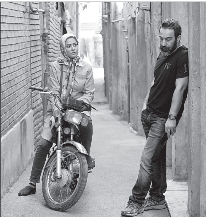
نمایی از فیلم «سه کام حبس» که این روزها در اکران است