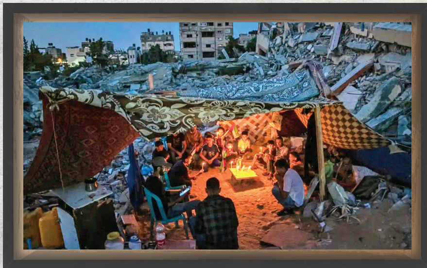
این تصویر را «فاطمه شبیر» عکاس-خبرنگار ۲۵ ساله متولد غزه، از کودکان و نوجوانان ساکن در ویرانه های باریکه غزه زیر نور شمع گرفته و جایزه وولد پرس فوتو ۲۰۲۲ را در منطقه آسیا از آن خود کرده است.