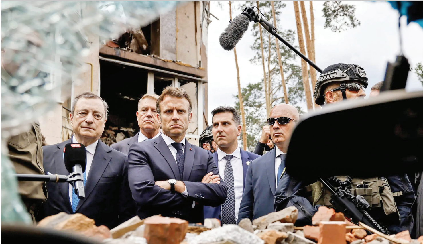
بازدید سران کشورهای اروپایی از ریزش‌های جنگ در کی‌یف.

کمیسیون تحقیق که تاکنون بیش از ۱۴۰ هزار سند درباره حمله به کنگره را بررسی و با بیش از هزار شاهد گفت‌وگو کرده، در نشست قبلی خود ترامپ را مسئول حمله هواداران‌اش به ساختمان کنگره و تحریک آنها به شورش معرفی کرد. این کمیسیون ترامپ را متهم کرد که به دنبال «کودتا» بوده است. یک شاهد در سومین نشست کمیسیون تحقیق گفت که با وجود نزدیک شدن مهاجمان به ساختمان کنگره و اصرار مأموران امنیتی برای خارج کردن مایک پانس، او با این استدلال که خروجش از ساختمان کنگره فراتر از وظیفه او است، مانده در آنجا و به سرانجام رساندن نشست مشترک برای تأیید نتیجه انتخابات یقینش را کرد. به این ترتیب، معاون اول ترامپ با ماندن در کنگره و پس از چند ساعت وقفه ریاست نشست مشترک را بر عهده گرفت و زمینه تأیید رسمی جو بایدن به عنوان چهل‌وششمین رئیس جمهوری آمریکا را فراهم کرد. مایک پانس پیش از ظهر ششم ژانویه و قبل از رفتن به ساختمان کنگره در نامه‌ای دلایل عدم‌همراهی با دونالد ترامپ را شرح داده و مهم‌ترین علت آن را سوگند برای حفاظت از قانون اساسی ایالات متحده عنوان کرده بود.